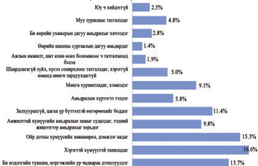
Зураг 2. Залуучуудын амьдралын зорилго, төлөвлөгөөгөө хэрэгжүүлэхийн тулд авах шаардлагатай арга хэмжээ

багтсан. Харин 2-р сегментэд амьдралын зорилгоо өөрчлөхөд бэлэн буюу эргэлзээтэй ханддаг нь илэрсэн бол, 3-р сегментэд амьдралын хэтийн зорилгоо тодорхойлоогүй залуучууд багтсан байна.