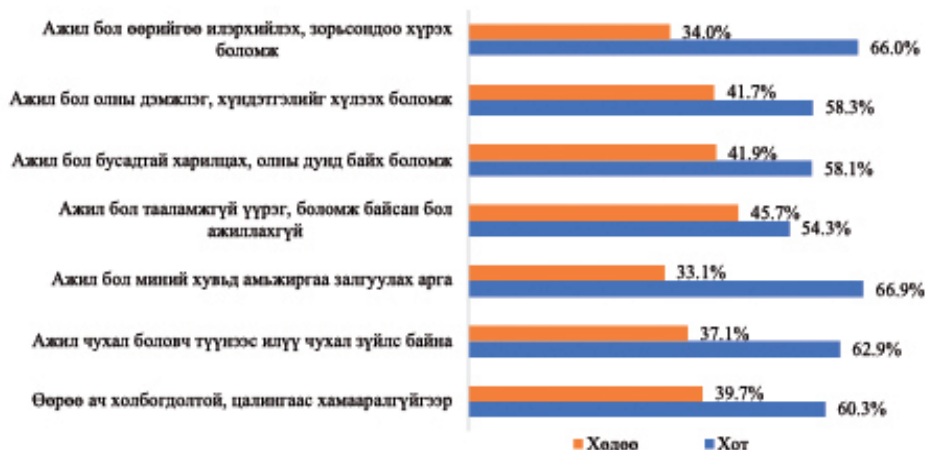
Зураг 4. Залуучуудын амьдралд ажил хэр зэрэг чухал байгааг хот, хөдөөгөөр харьцуулсан байдал

Судалгаанд хамрагдсан хотын залуучуудын 66.9 хувь нь ажил бол миний хувьд амьжиргаа залгуулах арга хэрэгсэл, 66.9 хувь нь ажил чухал боловч түүнээс илүү чухал зүйлс байгаа, ажил бол өөрийгөө илэрхийлэх, зорьсондоо хүрэх боломж гэж үзэж байгаа илэрхийлсэн байна. Харин хөдөө орон нутагт амьдардаг залуусын хувьд ажил бол тааламжгүй үүрэг, боломж байсан бол ажиллахгүй, ажил бол олны дэмжлэг, хүндэтгэлийг хүлээх боломж мөн бусадтай харилцах, олны дунд байх