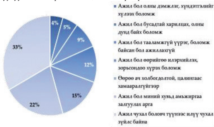
Зураг 3. Залуучуудын амьдралд ажил, хөдөлмөр хэр ач холбогдолтой болох

Залуучуудын амьдралд ажил, хөдөлмөр эрхлэх нь хэр ач холбогдолтой болохыг тодруулахад, тэдний хувьд ажил, хөдөлмөр эрхлэх