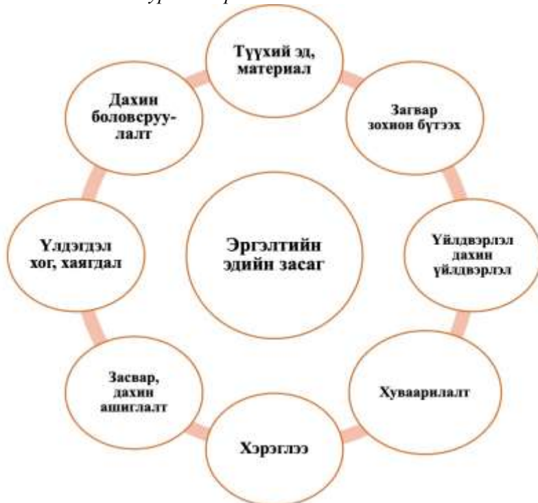
Зураг 4. Эргэлтийн эдийн засаг

Дижитал эдийн засаг бол эргэлтийн эдийн засгийг хөгжүүлэх чухал үндэс болж байна. Их өгөгдөл, эд юмсын интернет, хиймэл оюун, блокчейн зэрэг дижитал технологийг тогтвортой нөөцийн менежменттэй хослуулах замаар эргэлтийн эдийн засгийг хөгжүүлнэ. Өөрөөр хэлбэл, материал болон бүтээгдэхүүний эргэлтийг нэмэгдүүлэх, тэдгээрийн ашиглалтын хугацааг