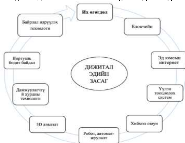
Зураг 2. Дижитал эдийн засгийн бүрэлдэхүүн хэсгүүд

Их өгөгдөл гэдэг нь байнга нэмэгдэж, өөрчлөгдөж байдаг асар их системчилсэн болон системчлээгүй мэдээллийг цуглуулах, боловсруулах, системчлэх, хадгалах, эрж хайх технологи юм. Энэ нь квант технологи болон мэдээлэл, харилцааны технологид үндэслэгдэн үйлчилнэ. Их өгөгдлийн эх сурвалж нь нэгд, эд юмсын интернет, хэмжих багаж, радио долгионы төхөөрөмжийн мэдээлэл, хоёрт, олон нийтийн мэдээллийн сүлжээ, гуравт, цаг