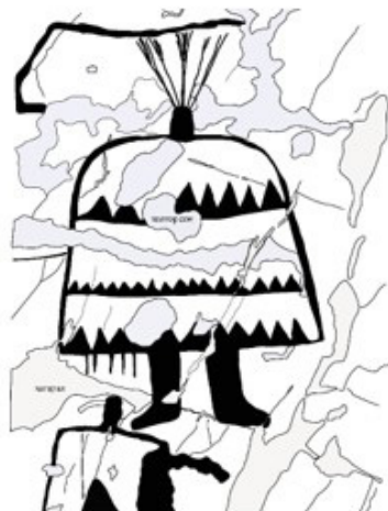
Их Ойгор-III, IV