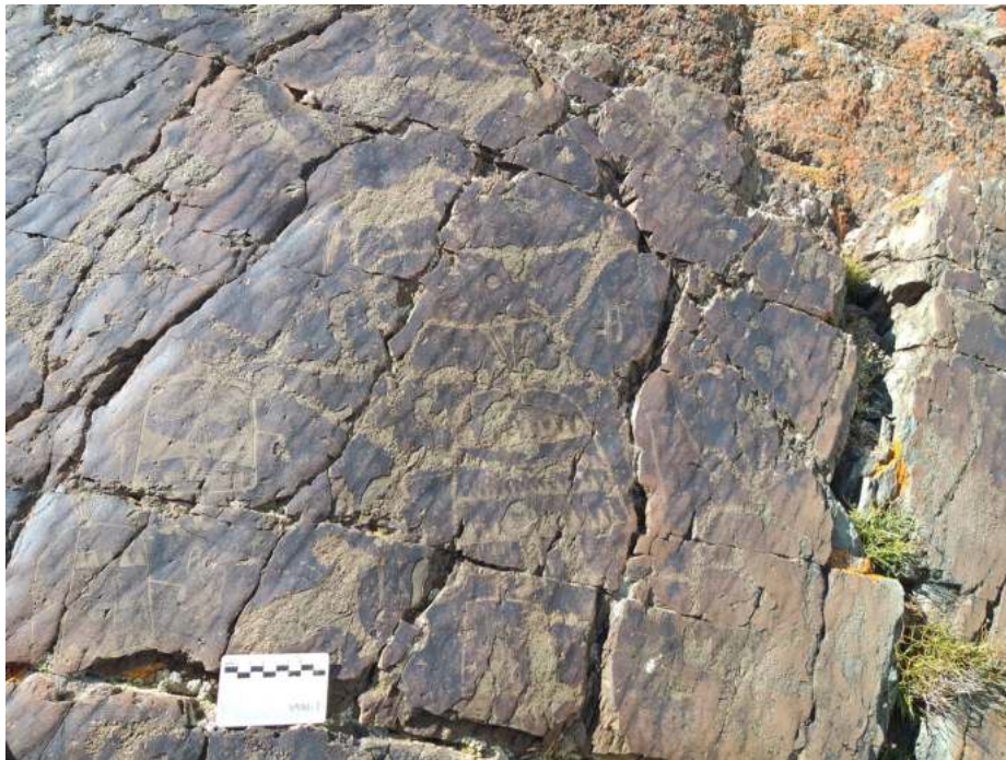
Их Ойгорын хадны зураг