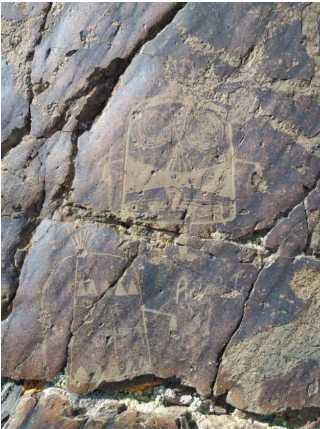
Их Оүзоп-I, II