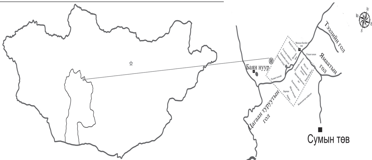
Зураг 1. Дурсгалт газрын байршлын зураг

Open Access This is an open access article distributed in accordance with the Creative Commons Attribution Non Commercial (CC BY-NC 4.0) license, which permits others to distribute, remix, adapt, build upon this work non-commercially, and license their derivative works on different terms, provided the original work is properly cited, appropriate credit is given, any changes made indicated, and the use is non-commercial. See: http://creativecommons.org/licenses/by-nc/4.0/ .