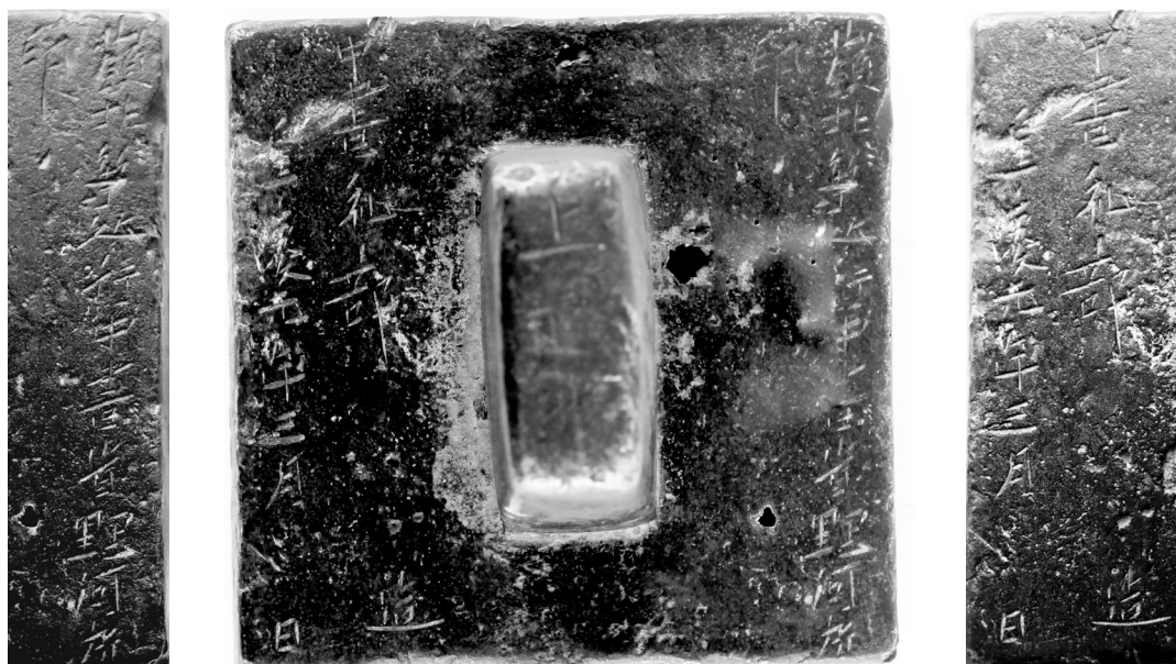
Нэгдүгээр тамга-Юань улсын үеийн тамга