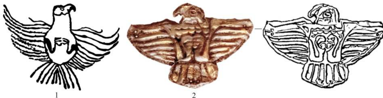
Зураг 6. Бүргэдийн дүрслэл 1. Хороон орой уулын хадны зураг, 2. Догээ-Баары-2 дурсгалын 20-р булшинаас гарсан алтан чимэглэл [Алексеева и др 2005; Иконников-Галицкий 2006]

Шувуудыг ингэж том, жижгээр нь ялган дүрсэлсэн нь санамсаргүй зүйл огт биш бөгөөд том шувууг гол шүтээн болгон харуулсан