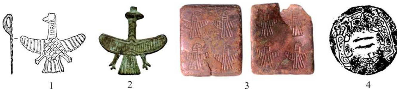
Зураг 4. Хөрш зэргэлдээх бүс нутгаас хүрлийн хожуу үеийн шувууны дүрст хүрэл эдлэлүүд. 1. Наншэнгэн-гийн М4-р булш [Zhongguo 1975], 2. Зүүн хойд Хятад [Bunker, Brosseder 2022], 3. Өвөр байгалийн Дворцов хэлбэрийн булш [Кириллов 1979: 89], 4. Хэнан мужийн Санмэншиа хотын Шанцуньлин-гийн М1612-р булш [Liu Ning 2000]