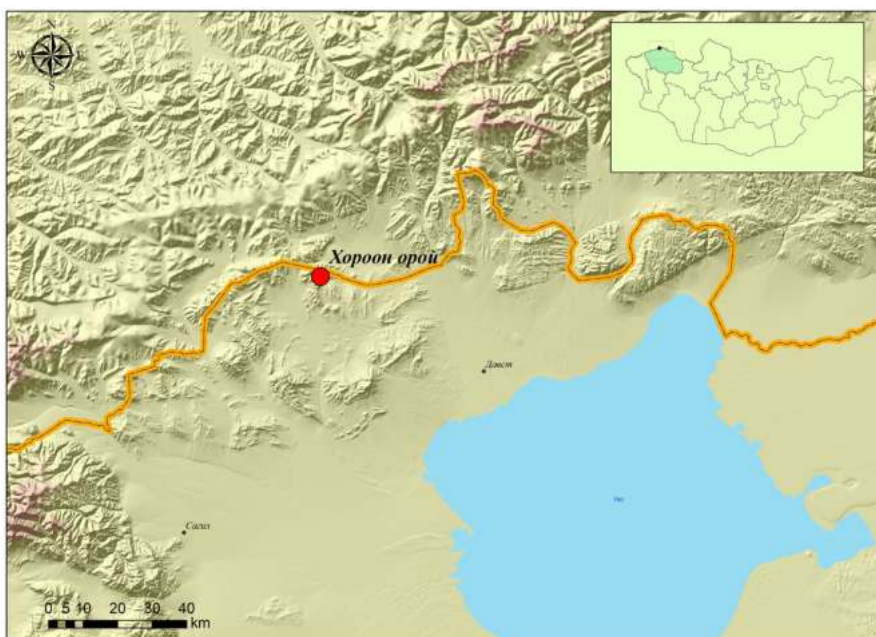
Зураг 1. Хороон орой уулын байршилгыг газрын зурагт тэмдэглэсэн байдал

тархалтын байдлаас хамааран бид хоорондоо нарийн жалгаар зааглагдсан талбайнуудыг дотор нь 5 хэсэгт хувааж баримтжуулалтын ажил хийв. Үүнээс I талбайд 78 хавтан, II талбайд 51 хавтан, III талбайд 18 хавтан, IV талбайд 20 хавтан, V талбайд 21 хавтан буюу нийт 198 хавтан чулуун дээр 2000 орчим тооны дүрслэл бий. Эдгээр зургууд нь он цагийн хувьд хүрлийн хожуу үеэс Уйгурын үе хүртэлх хугацаанд хамаарах бөгөөд бид энэ удаад зөвхөн шувууны дүрслэлийн тухайд дэлгэрэнгүй өгүүлэх болно.