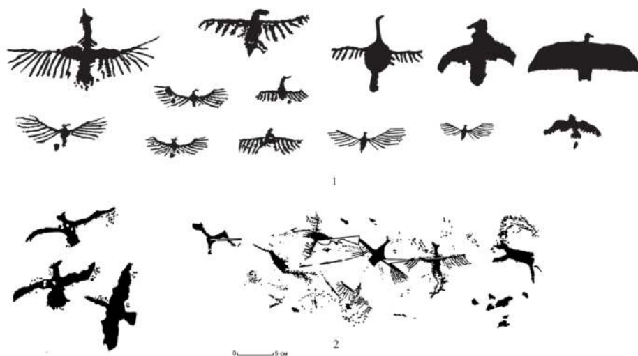
Зураг 3. Монгол Алтайн хадны зураг дахь шувууны дүрслэл. 1. Цагаан салаа, Бага Ойгур [Кубарев и др. 2005], 2. Шивээт хайрхан [Цэвээндорж нар 2010],

Хүрэл зэвсгийн үеэс шувуу нь шүтлэгийн нэгэн дүр болж дэлгэрсэн ба шувууны дүрслэл энэ үеийн хадны зураг төдийгүй овор ихт урлагийн дурсгал,