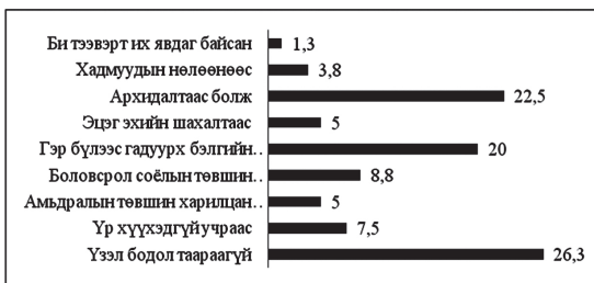
Зураг 3. Гэр бүл салалтын шалтгаан