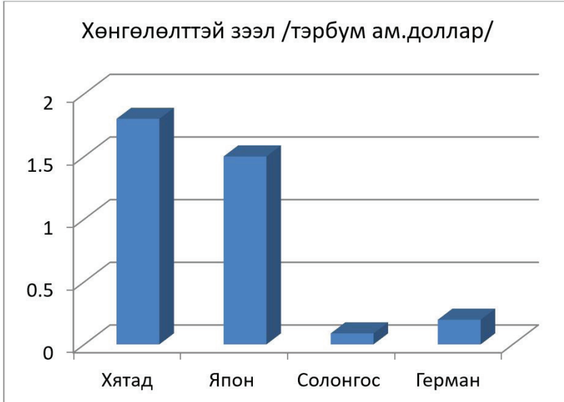
Зураг 3. Манай оронд үзүүлж буй гадаадын хөнгөлөлттэй зээл