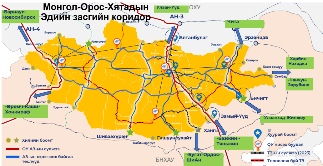
Зураг 3. Монгол-Орос-Хятадын Эдийн засгийн коридорын сүлжээ

Олон улсын автогэврийн харилцааны тухай Монгол Улс, БНХАУ-ын Засгийн газар хоорондын хэлэлцээрийг 2023 онд шинэчлэн байгуулсан нь Монголын тээвэрчдэд Хятадын нутаг дэвсгэрээр дамжин Вьетнам зэрэг Зүүн Өмнөд Азийн орнууд болон Төв Азийн Казахстан, Киргиз, Тажикистан руу дамжин өнгөрөх тээвэр хийх эрх зүйн боломжийг нээсэн. Одоогоор Хятадын тээвэрчид АН-3, АН-4 чиглэлийн дагуу Монголын нутаг дэвсгэрээр дамжин Орос руу тээвэрлэлт хийж эхэлж байгаа бол Монголын тээвэрчид хараахан яваагүй байна. Монголын тээвэрчид Хятадын нутаг дэвсгэрээр дамжин тээвэрлэлт гүйцэтгэхэд жолооны үнэмлэх, тээврийн хэрэгслийн улсын дугаар, жолоочийн ажил, амралтын дэглэмийг хянах төхөөрөмжийг олон улсын шаардлагад нийцүүлэх, хариуцлагын даатгалын сүлжээнд хамрагдах зэрэг асуудлыг шийдвэрлэх шаардлагатай байна.