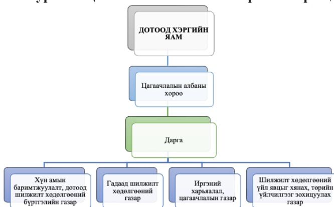
Зураг 4. Цагаачлалын албаны хорооны бүтэц

Гадаадын иргэдийн бүртгэл, оршин суухтай холбогдсон асуудлыг Дотоод хэргийн яамны харьяа Цагаачлалын албаны хороо (Комитет миграционной службы) эрхлэн хэрэгжүүлдэг бол хөдөлмөр эрхлэлттэй холбоотой асуудлыг Хөдөлмөр, нийгмийн хамгааллын яам хамтран хариуцдаг тогтолцоотой байна.