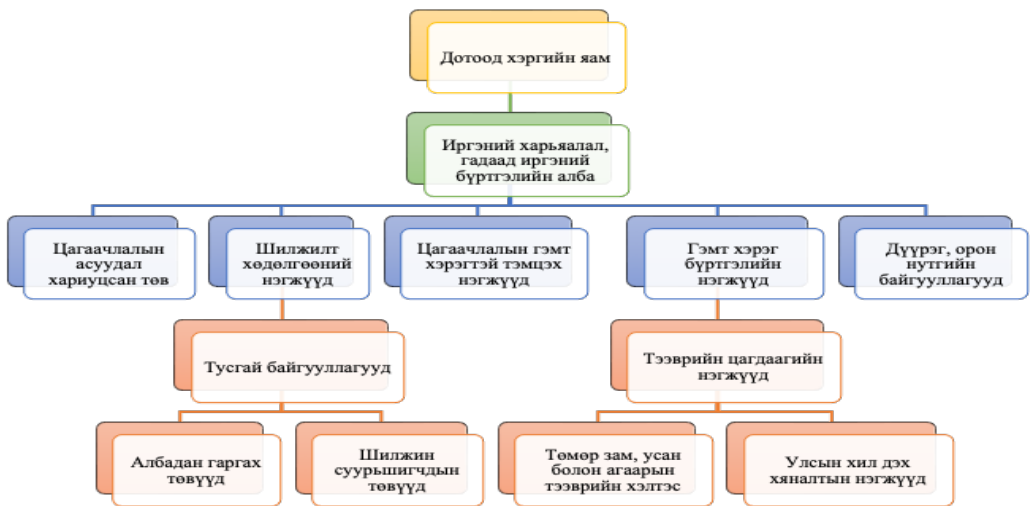
Зураг 1. Иргэний харьяалал, гадаад иргэний бүртгэлийн албаны бүтэц

ОХУ-ын хууль тогтоомжид гадаадын иргэдийг оршин суух хугацаанаас нь хамааруулан дараах гурван үндсэн ангилалд хуваадаг. Үүнд: