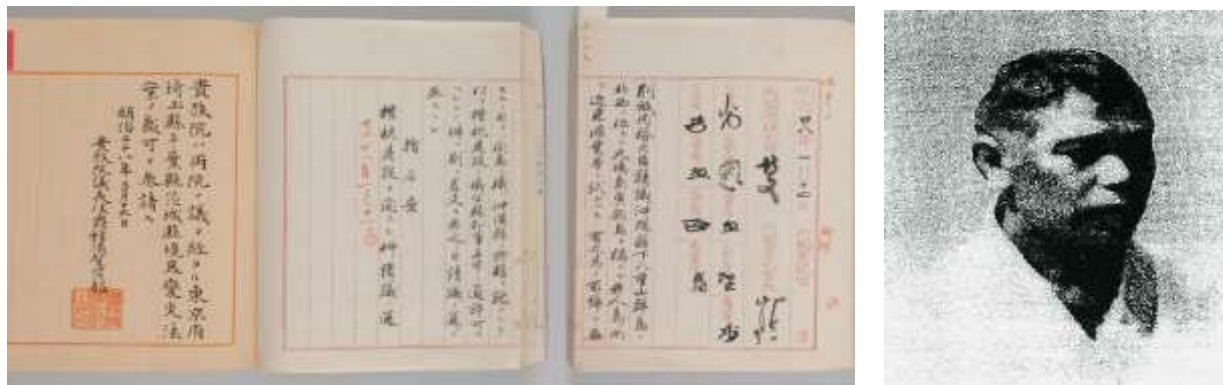
Зураг 2. 1896 оны Засгийн газрын түүрээслүүлэх шийдвэр

1945 онд Дэлхийн 2 дайнд Япон улс Америкийн Нэгдсэн Улсад буун өгснөөр Холбоотны дээд командлалын шийдвэрээр Америкийн шууд хяналтанд Сэнкакү арлуудыг оруулжээ. Хэдийгээр 1951 оны Сан Францискогийн гэрээгээр Японы тусгаар тогтнолыг хүлээн зөвшөөрсөн ч Сэнкакү арлын эзэмших эрхийг буцааж өгөөгүй байна. 1975 оны 5 сард Окинаваг буцаан өгснөөр түүний нэг хэсэг болох Сэнкакү арал Японд эргэн ирсэн юм. 1978 онд Кога Сэнжи нас барж, залгамжлах хүн байхгүй болсноор уг арлыг эзэмших эрх найзад нь очив. 2002 онд Японы Засгийн газар зээлээр ашиглах гэрээ байгуулж байсан бол 2012 онд Токио хотын захиргаа уг арлыг худалдан авсанаа зарласан байна.