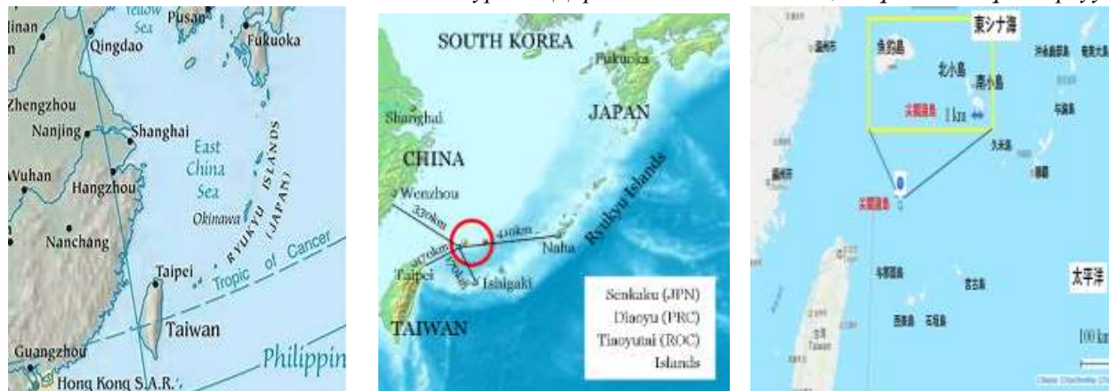
Зураг 1. Дорнод Хятадын тэнгис, Рюүкюгийн бүлэг арлууд

эзэлдэг нэр бүхий 50, 400 орчим нэргүй арал таран байрладаг. Хамгийн том арал нь Окинава арал бөгөөд 1211 км 2 талбай эзэлнэ. Сэнкакү бүлэг арал нь 5.56 км 2 талбайтай 5 арал, 3 хадаас бүрдэнэ. Үоцүрүшима (魚釣島), Киткожима (北小島), Күбашима (久場島), Тайшѐто (大正島), Минамикожима (南小島), Окинокитаива (沖ノ北岩), Окиноминамиива (沖の南岩), Тобисэ (飛瀬) гэсэн арлууд багтдаг байна. Тус арлыг 2020 оны 12 сарын 1-нээс Тonoширосэнкакү (登野城尖閣) гэж нэрийг Ишигаки хотын хурал баталсан болно. 2012 оны 1 сарын 16-д Японы Засгийн газар эдийн засгийн онцгой бүсэд хамааруулсан байна.