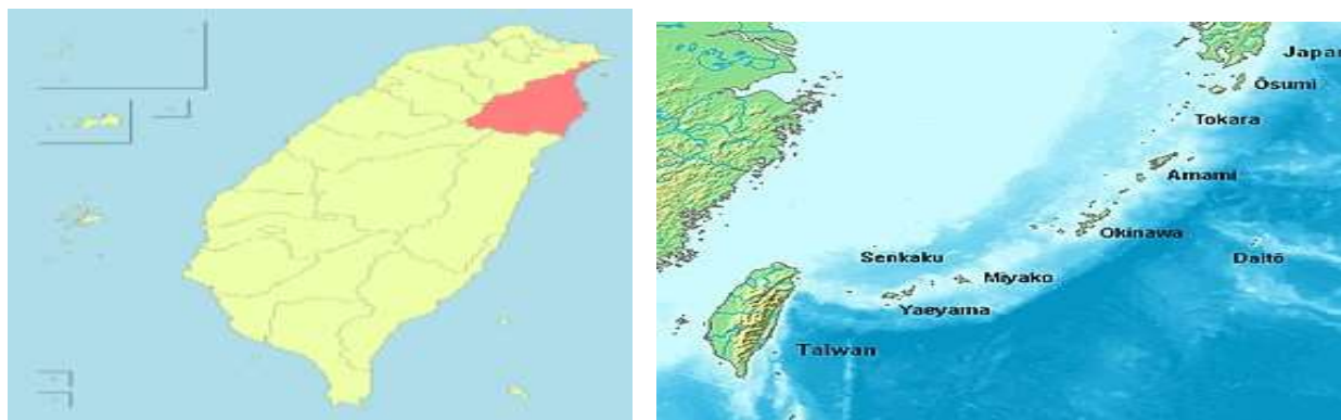
Зураг 3. Хятадын Тайваны Гийран муж ба Дяюйдао бүлэг арлууд

Учир нь 1429 онд Шёо Хашио/尚巴志/ хэмээх хаан Шюри/首里/-г нийслэлтэй Рюүкюү /琉球王国/ буюу /одоогийн Окинаваг/ улсыг байгуулж, 450 жил оршин тогтносон бөгөөд 19 дэх үеийн хамгийн сүүлчийн хаан нь 1872 он хүртэл ёс төдий захирч байлаа. Хэдийгээр 450 жил бие даан оршин тогтнож ирсэн гэх боловч, 14-р зуунд Чюү Зан гэгч хаан Мин улсын хаанд алба өргөж, цол хэргэм авч харьяанд нь орж байв. Мин, Чин гүрэн ч, Японы төв засаг захиргаа ч аль аль нь өөрийн элчин төлөөлөгчийг Рюүкюү улсад нэгэн зэрэг томилон суулгаж өөрийн харьяаны улс гэж үзэж