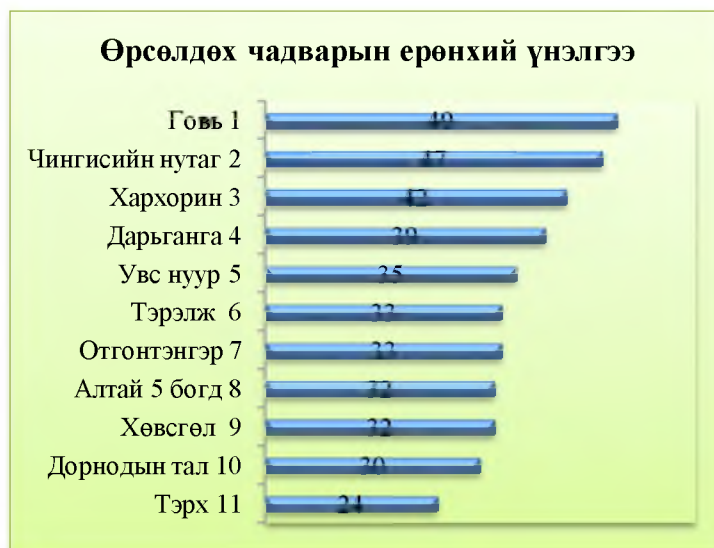
2-р зураг. Өрсөлдөх чадварын ерөнхий үнэлгээ

Өрсөлдөх чадварыг үнэлэхдээ: 47-66 хооронд өрсөлдөх чадвар сайн 27-46 хооронд өрсөлдөх чадвар дунд 0-26 хооронд өрсөлдөх чадвар муу гэж үзнэ.