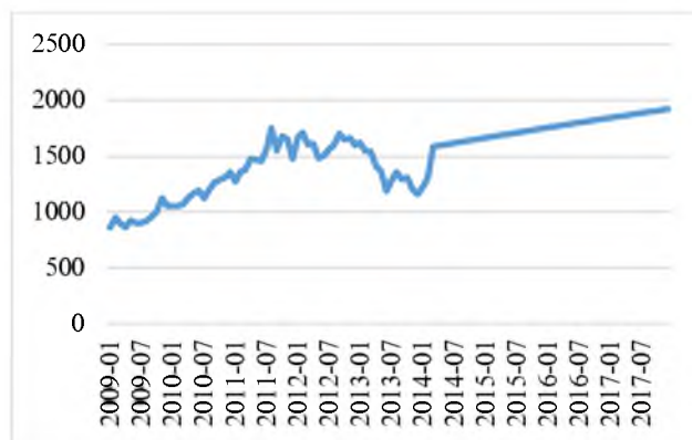
1-р зураг. Алтны үнийн таамаглал, ам доллар.унц, 2009.01-2017-12

Ингээд алтны үнийг бусад валютын ханшаас хамааруулан ирэх 4 жилээр таамаглахад дараах байдалтай байна.