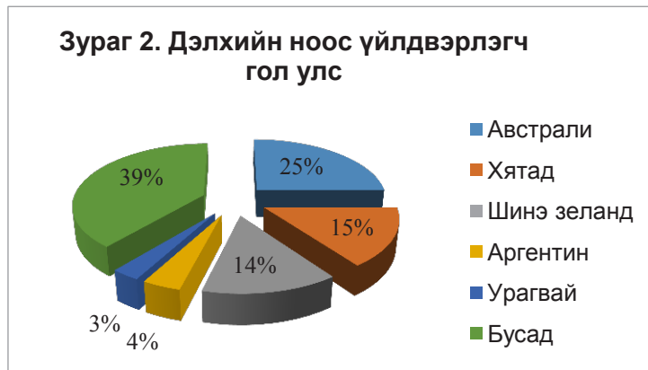
2-р зураг. Дэлхийн ноос үйлдвэрлэгч гол улс

Дэлхийн ноосны зах зээлийн хандлагаас харахад сүүлийн жилүүдэд түүхий ноосны үнэ болон экспортын хэмжээ буурах хандлагатай байгаа ч 2011 оноос хойш экспортын хэмжээ 1-2%-иар [4] өсөж байна.