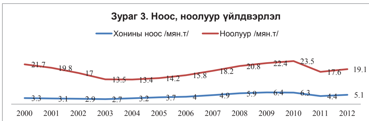
3-р зураг. Ноос, ноолуур үйлдвэрлэл (2000-2012 он)

ноолуур үйлдвэрлэж ноосны 23%, ноолуурын 70%-ийг [1] [3] экспортод гаргаж байна. Ноос, ноолуурын үндэсний хэмжээний томоохон компаниудын үйлдвэрлэлийн хэмжээ өсөж байгаа боловч экспортод гаргах бүтээгдэхүүний нэр төрлийг нэмэгдүүлж, борлуулах зах зээлийг тэлэхэд төрийн дэмжлэг чухал байна.