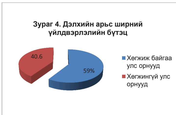
4-р зураг. Дэлхийн арьс ширний үйлдвэрлэлийн бүтэц

хэмжээгээр АНУ, Европын холбоо, Бразил, БНХАУ зэрэг улсууд тэргүүлж байна. Австрали, Шинэ Зеланд зэрэг улс орнууд хонь, ямааны боловсруулсан арьсны экспортын хэмжээгээр тэргүүлэх байр суурь эзэлж байна.