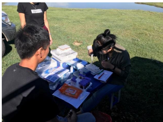
3-р зураг. Хээрийн хэмжилт