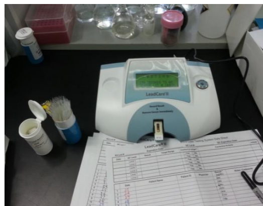
4-р зураг. LeadCare II багаж