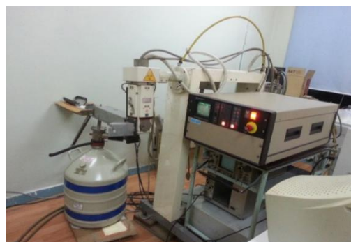
2-р зураг. Бүрэн ойлтын рентген флуоресценцийн спектрометр (БОРФС)