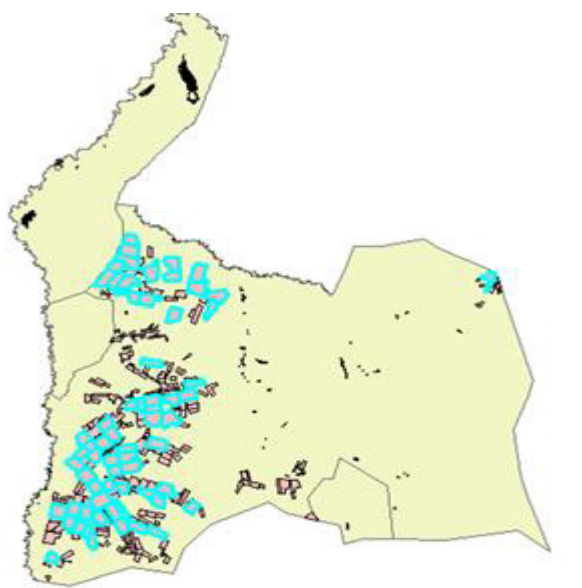
2-р зураг. Дархан-Уул аймгийн тариалангийн газар, 200 га-аас их хэмжээтэй талбайн байршилт

байх зүй тогтлыг алдагдуулахад хүрч байна. Агрolandшафт нь хэдий чинээ олон төрлийн, нийлмэл бүтэцтэй байх тусам төдий чинээ гадны янз бүрийн нөлөөнд тэсвэртэй, тогтвортой байдаг байна [2,3,4]. Гэтэл тус аймгийн тариалангийн талбайнууд нь байршлын хувьд 1 дор хэт их бөөгнөрсөн, 70 нэгж талбар 200 га-аас дээш талбайтай байгаа нь аж ахуйн хувьд ач холбогдолтой ч экологийн тогтвортой бус нөхцлийг бий болгохуйц байдалтай байна (2-р зураг).