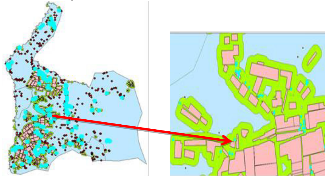
3-р зураг. Хуулиар хориглох зурвасд хамрагдаж буй өвөлжөө, хаваржаа

тэнцэх хэмжээний төгрөгөөр торгохоор 28.1.10-т тусгагдсан байдаг. Эдгээр заалтын хэрэгжилтийг хангах явцад тариалангийн талбайн захаас гадагш 500 метрийн зайд 216 өвөлжөө, хаваржааны эзэмшил газар хамрагдаж, 41926 га талбай бэлчээрээс хасагдах тооцоо гарч байна (3-р зураг).