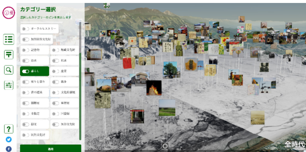
Зураг 2. Минами-Альпс хотын “Мару музей архив” ( https://archives.maruhakualps.jp/ )

“Орон нутгийн мару мару музей” хөтөлбөрийн хүрээнд цуглуулсан мэдээллийг нь орон нутгийн захиргааны соёлын өвийн мэргэжилтэн судалж Орон нутгийн уламжлалын музейд жил бүр үзэсгэлэн зохион байгуулахаас гадна “мару музей архив” хэмээн цахим хэлбэрээр үзүүлж нийтийн хүртээл болгодог. “Мару музей архив” нь орон нутгийн соёлын биет болон биет бус өвийн мэдээлэл, түүнтэй холбогдох иргэдийн ярилцлагын бичлэгийг хадгалдаг мэдээллийн сан бөгөөд өгөгдлийг Digital Earth дээр харуулах болно (Зураг 2).