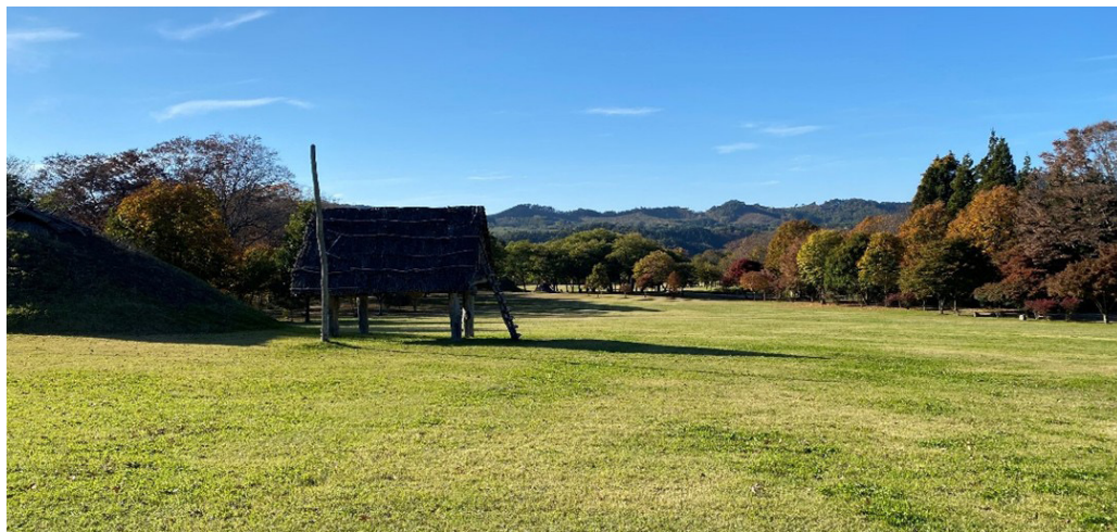
Зураг 3. Гошоно археологийн дурсгалт газрын паркийн ерөнхий байдал

Гошоно түүхэн дурсгалт газар нь 1980 онд орон сууцын барилга барихын тулд хийлгэсэн авран хамгаалах судалгаагаар илэрсэн бөгөөд орон нутгийн иргэдийн хүсэлтийн дагуу орон сууцын бүтээн байгуулалтын ажлыг зогсоож тус дурсгалт газрыг хамгаалалтад авахаар шийдвэрлэсэн байна. Энэхүү дурсгалт газрыг 1993 онд улсын хамгаалалтад авчээ. Мөн 2021 онд “Зүүн хойд Япон дахь Жомоны үеийн дурсгалт газрууд”-ын нэг хэсэг болгон Дэлхийн өвд бүртгүүлжээ.