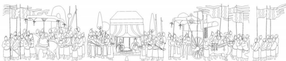
Зураг 1. б Шюй Шяньшю бунхны ханын зураасан зураг. Б.Хүчит 2025.