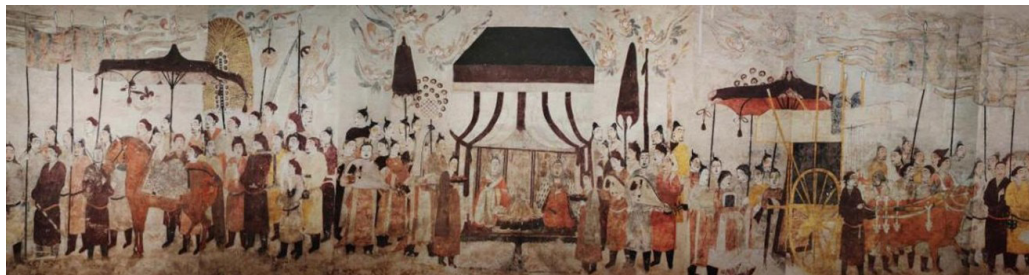
Зураг 1. а Шюй Шяньшю бунхны ханын өнгөт зураг. VI зуун. БНХАУ-ын Шяньши мужийн Тайюань дахь умард Чи улсын ханын зургийн музей. Б.Хүчит 2024.