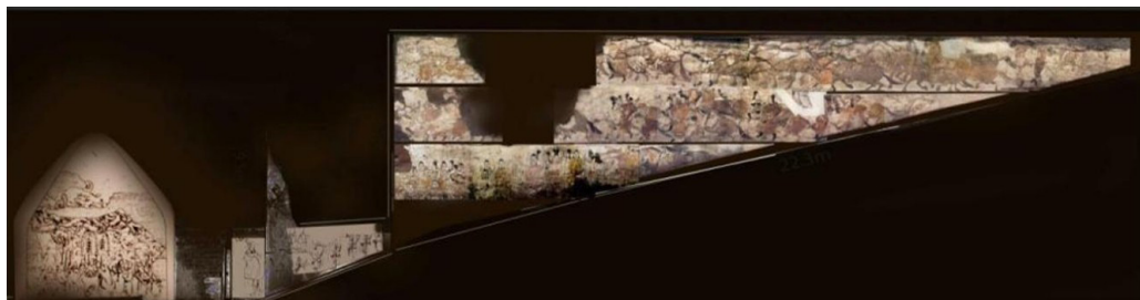
Зураг 3. а Лөү Рүй бунхны зүүн ханын өнгөт зураг. Умард Чи улсын Дунан ван Лөү Рүйгийн бунхан 2006. Б.Хүчит 2025.