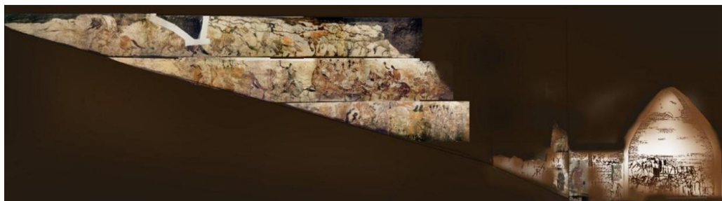
Зураг 2. а Лөү Рүй бунхны баруун ханын өнгөт зураг. Умард Чи улсын Дунан ван Лөү Рүйгийн бунхан 2006. Б.Хүчит 2025.