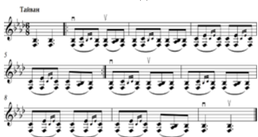
Зураг 1. “Элхэндэг” бийгийн татлага