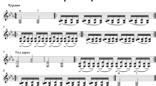
Зураг 2. “Жороо морь” бийгийн татлага

Жороо морь: “Морины явдал, гишгэдийг таньж, ялгаж ярьдаг нь монголчуудын нүүдэлчний зан заншлаас бий болсон соёл” юм. Монголчууд жороо морины явдлыг хонин жороо, сайвар жороо, усан тэлмэн жороо гэх мэт нэрлэж байсан. Баядын “Жороо морь” бий нь бийчийн ур чадварыг илтгэсэн золбоолог бий юм (Эрдэнэцэцэг 2023, 22).