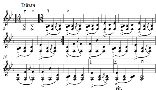
Зураг 3. “Ихэлээрээ наадъя” Дуут бийгийн татлага