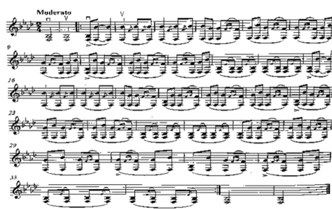
Зураг 4. (Б). “Дөрвөн Ойрад” Ихэлийн татлага

Баяд ихэлийн татлагын талаар ихэлч Ж.Хумбаа: