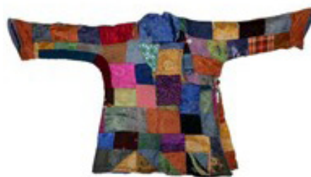
Зураг 9. Энхэр хүүхдийн дээл. XX зуун. Хэнтий аймгийн музей

Энхрий хүүхэддээ зүймэл баривч хийх зан үйл одоо ч бидэнд хадгалагдаж байгааг зарим хувцас үйлдвэрлэгчдийн бүтээгдэхүүнээс харж болно. Зүймэл хувцас хэрэглэл нь түгээмэл төдийгүй бас ширмэл хувцаснууд үйлдвэрлэлд нэвтэрч, түүн дээрх ширмэлийн хээ загвар улам боловсронгуй болсоор байна (Зураг 10).