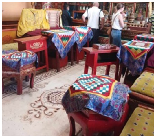
Зураг 7. Дингов. 2020 он. Төв Гандантэгчилэн хийд

Мөн энд зүйж хийх технологи бүхий энхрий хүүхдийн зүймэл баривчийг дурьдах нь зүйтэй. Монголчууд эртнээс үр хүүхэд тогтохгүй байх болон өвчин ороомтгой үед хүүхдийнхээ хүйсийг нь нууж хувцаслах, олон нөхөөст ба буруу энгэртэй дээл хувцас хийж өмсгөдөг уламжлалтай байжээ (Зураг 8,9). Энэ зан үйл нь нэлээд эртнийх боловч яг хэзээнээс эхэлсэн нь тодорхой бус байдаг нь холбогдох олдвор одоогоор олодоггүй байгаатай холбоотой. Гэсэн хэдий ч үүнийг судлах шаардлагатай бөгөөд ялангуяа одоо байгаа хөдрөгт хамаарах хийц загвар бүхий олдворуудад судалгаа хийх шаардлагатай байна.