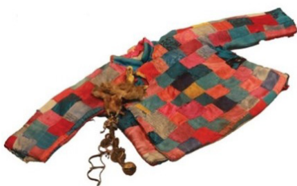
Зураг 8. Энхрий хүүхдийн баривч. XIX зуун. Монголын үндэсний музей

Мөн энд зүйж хийх технологи бүхий энхрий хүүхдийн зүймэл баривчийг дурьдах нь зүйтэй. Монголчууд эртнээс үр хүүхэд тогтохгүй байх болон өвчин ороомтгой үед хүүхдийнхээ хүйсийг нь нууж хувцаслах, олон нөхөөст ба буруу энгэртэй дээл хувцас хийж өмсгөдөг уламжлалтай байжээ (Зураг 8,9). Энэ зан үйл нь нэлээд эртнийх боловч яг хэзээнээс эхэлсэн нь тодорхой бус байдаг нь холбогдох олдвор одоогоор олодоггүй байгаатай холбоотой. Гэсэн хэдий ч үүнийг судлах шаардлагатай бөгөөд ялангуяа одоо байгаа хөдрөгт хамаарах хийц загвар бүхий олдворуудад судалгаа хийх шаардлагатай байна.