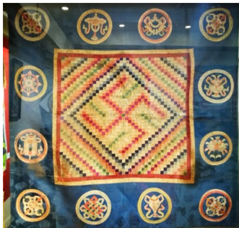
Зураг 6. Бурхны хөшиг. XIX зуун. Богд хааны ордон музей. Монгол