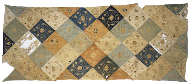
Зураг 3. Торгон зүймэл, XIII зуун Юань гүрэн. Метрополитын урлагийн музей. АНУ

зэрэг нэрээр тухайн үеийн судар бичгүүдэд нэрлэгдэн үлдсэн байдаг) юм. Түүний сэтгэж хийсэн, зохион бүтээсэн малгайны саравч, ууж хэлбэрийн оноотой дээл, арвич хямгач зангаас нь улбаалан дахин ашиглаж хийсэн торго зэргүүд нь тухайн цаг үеийн судар бичигт тэмдэглэгдсэн үлдсэн байдаг байна (Моррис Россabi 2011, 81,82). Чаби хатны арвич хямгач занг Юань гүрний судруудад ихэд шоолонгуй өнгө аясаар бичсэн тухай эх сурвалжуудад дурдсан байна. Тэрээр буддын шашныг ихэд шүтэж дээдэлдэг байсан юм. Тухайн үеийн бурхан тахилд хэрэглэдэг байсан эдгээр эдлэлүүдийг зүйж хийхдээ маш нарийн чимхлүүр хатгамлаар чимэглэдэг байсан. Жишээлбэл, Зураг 3 –т байгаа зүйдэл бүр дээрх цэцгэн хатгамлыг алтан утсаар зүү ороож оёсон байдаг нь монгол хүн хийсэн байхыг үгүйсгэхгүй.