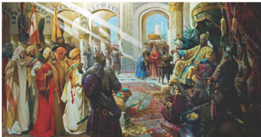
“Тогоонтөмөр” 2022 он, зотон, тосон будаг, 500x200см