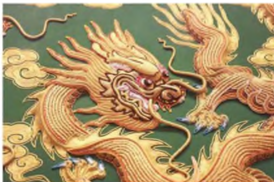
Зураг 14. Сийлбэр адил товойлгон дүрсэлсэн хатгамлан бүтээл 19