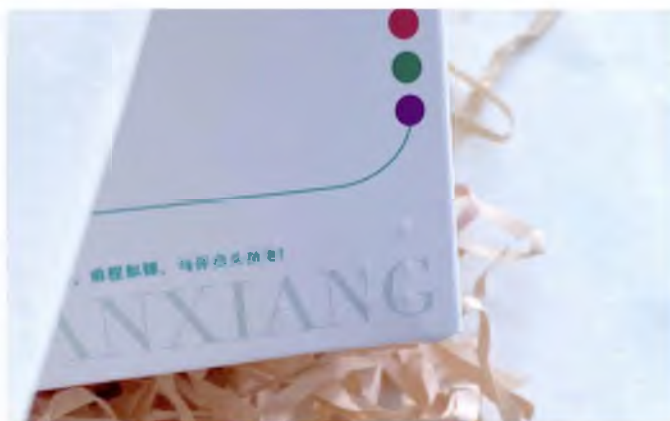
Зураг 26. Сав баглаа боодол дээр дүрслэгдсэн брайл үсгийн товгор дардас 22

Нэгдүгээрт, брайл цагаан толгойн товгор дардсыг нэмж оруулна. Хатгамал гар урлалын хувьд харааны хүртэхүйгээс гадна хүрэлцэх мэдрэмж чухал байдаг. Тийм ч учраас сав баглаа боодлын нэг талын баруун доод буланд ханзны брайл үсгийг оруулснаар хүрэлцэх мэдрэмжийг нэмэгдүүлж, хүмүүсийн тэр болгон анзаардаггүй, орхигдуулдаг тусгай хэрэгцээт хэрэглэгчдийн бүлгийг анхааралдаа авсан билээ ( Зураг 26 ).