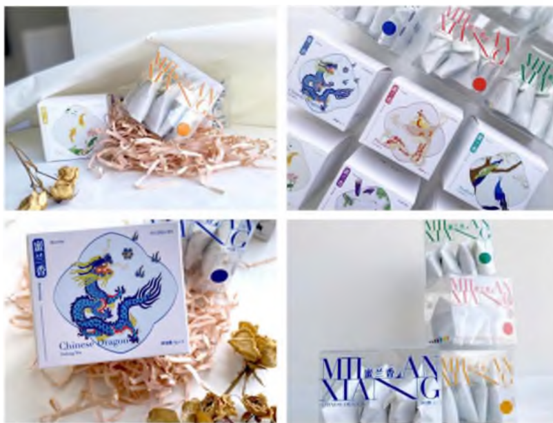
Зураг 22-25. Сав баглаа боодол 21

цогцлоохын тулд эртний уламжлалт хийц дээр орчин үеийн өнгө аястай энгийн хялбар хэв маягийг нэгтгэн, байгаль дэлхийн долоон төрлийн объектыг үндсэн хэсэг болгон илэрхийлэхдээ цагаан өнгөтэй хослуулж, хүндээс хөнгөн рүү шилжих хэлбэрээр илтгэн харууллаа. Үүний дараагаар эртний уран бичлэгийг бүгдэд ойлгогдохуйцаар орчин үеийн өнгө төрх бүхий шинэлэг бүтээлд шигтгээ болгон оруулж өгснөөр уламжлал, орчин үе хэмээх хоёр ойлголт хоорондоо уусан бусдаас содон эрч хүч, таашаан үзэх сонирхлыг тод томруунаар харуулсанд гол утга оршино. Нөгөө талаас орчин үед өргөн дэлгэрсэн ins хэв маяг, брайл цагаан толгой мэт зураг дүрсийг бүх гадаргуу дээр бүтээн, Милан шян даньцун хэмээн галиг үсгээр буулган, дизайны өндөр түвшний мэдрэмжийг харуулахын тулд энгийн зурган хэлбэрийг хэвлэлийн форматын загварт оруулж шинэчилсэн бөгөөд ингэснээр хэрэглэгчид сав баглаа боодол дахь уламжлалт соёлын үнэ цэнийг шинэ содон визуал хүртэхүйн өнцгөөс бүрэн дүүрэн мэдрэх боломжтой болох юм ( Зураг 22-25 ).