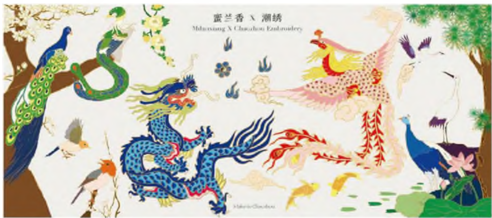
Зураг 34. Их цуглаан 24