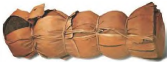
图3 茶叶饼茶团五子包