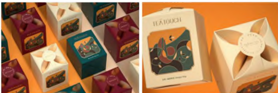
Зураг 7-8. Teatouch 10

Хятадын шинэ цайны брэнд болох TEATOUCH нь дорнын соёлыг орчин үеийн хэв маягт оруулснаар олон мянган жилийн түүхтэй цайны соёлыг өнөө үеийнхэнд гоо сайхан зураг дүрслэлээр дамжуулан амар хялбар ойлгуулж өгдөг (Зураг 7-8).