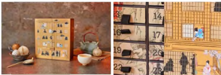
Зураг 9-10. Япон хэв шинжтэй цайны сав баглаа боодол 11

Эрт дээр үеэс хүмүүн төрөлхтөн хоол хүнсээ хадгалах, зөөвөрлөн авч явахын тулд сав баглаа боодлыг ашиглаж эхэлсэн бөгөөд гадаад улс орны сав баглаа боодлын технологи барууны аж үйлдвэрийн хувьсгал хүртэл Хятадаас хоцронгуй байсан нь барууны орчин үеийн сав баглаа боодлын дизайны хурдацтай хөгжлийг түргэсгэж өгчээ. Дэлхийн улс орнуудын сав баглаа боодлын дизайн нь тухайн нутаг орны соёл, зан заншил, үндэстний онцлог шинж чанарыг тусгасан байдаг. Тухайлбал, Япон хэв шинжийг агуулсан цайны сав баглаа боодлын дизайн нь энгийн онцгойрох зүйлгүй байшин сууц мэт харагдах боловч Япон соёлыг сав баглаа боодлын дизайнд уран нарийн аргаар тусган харуулжээ. Сав баглаа боодолд дүрслэгдсэн дүр, үйл хөдлөлийн төлөв байдал нүдэнд үзэгдэж гарт баригдам, жижиг сажиг нарийн чимхлүүр үйл ажиллагааг тал бүрээр харуулж өгснөөр Японы өвөрмөц содон өнгө аясыг бүрэн дүүрэн мэдрүүлэхээр шийдэгджээ ( Зураг 9-10 ).