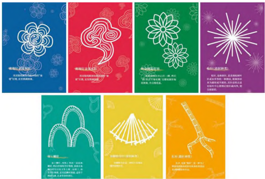
Зураг 27-33. Чаожюү хатгамлын хялбаршуулсан карт 23

цогц нэгдлийг харуулсан. Дүрслэлийн онцгой аргаар сэтгэл хөдлөл болон төсөөллийг зоригтойгоор илэрхийлж, цаг хугацаа, орон зайг эвдэн, үзэл бодол пропорциональ харьцаа зэрэгт баригдалгүйгээр байгалийн аливаа юмс үзэгдлийг бүтээлч, эв зохиролтой байдлаар хослуулж, эв нэгдэл, бүрэн бүтэн байдлыг ханган, саад тотгорыг даван, агуу эв нэгдэлд хүрэх сайн сайхан хүсэл эрмэлзлэлийг харуулсан нь уламжлал ба орчин үе, үндэстэн хоорондын цаашлаад дэлхийн улс орнуудын соёлын харилцааг бэхжүүлэх утга санааг агуулсан билээ.