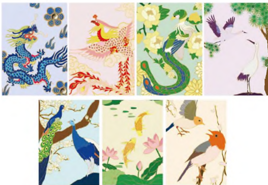
Зураг 15-20. Сав баглаа боодолд тусгах хатгамалын зургийн эскиз 20

Чаожөү хатгамлын соёлыг улам бүр хөгжүүлэхийн тулд соёл болоод урлагийн онцлог шинж чанарыг гүнзгийрүүлэн судлах шаардлагатай. Устаж мөхөхийн ирмэгт тулж ирсэн Чаожөү хатгамлын гар урлалын технологийг судлан хадгалан хамгаалж, ахмад үеийн Чаожөү хатгамалчдын их мастеруудын мэргэн ухаан, бүтээлч санааг өвлөн уламжлуулахын тулд хээрийн судалгааны ажлын үеэр Чаожөү хатгамлын соёлыг гүнзгийрүүлэн судалж, Чаожөү хатгамалтай холбоотой зохиол бүтээлийг уншиж судлах явцдаа бүтээн туурвих урам зоригтой болж, Чаожөү хатгамлын олон гайхалтай бүтээлүүд дундаас ахин шинээр загвар гаргах элементийг сонгон авсан юм. Үүнд: “Есөн луугийн хөлт эрдэнийн хүлс”-ээс лууг, “Есөн гардийн хөлт эрдэнийн хүлс”-ээс гардийг, “Галбинга гарди гүйлс”-ээс галбингааг, “Нарс, тогоруу урт насыг бэлгэднэ” зурагнаас тогорууг, “Үүрийн туяа” зурагнаас бялзуухайг, “Дүүлэн нисэх”-ээс загасыг, “Мандарваа шувууны зураг” дотроос шувууг сонгон авахын сацуу галын дөл, өлзий угалзан үүл, мандарваа цэцэг, эртний нарс, гүйлс, бадамлянхуа, бадамлянхуа цэцгийн навч зэргийг туслах дэвсгэр элементээр орчин үеийн дизайны арга техниктэй хослуулан амьдлаг байдлаар харуулахыг хичээсэн билээ (Зураг 15-21).