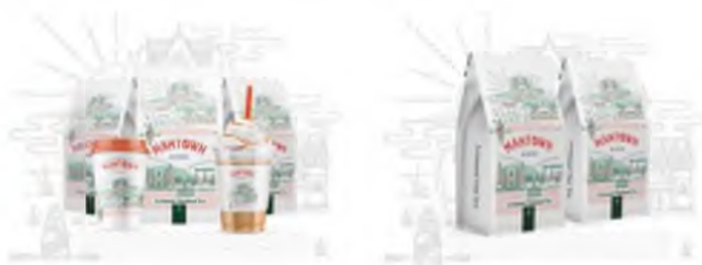
Зураг 11-12. Тайландын Mantown цай 12

Ман Сити Коффигийн бүтээгдэхүүний нэг Тайландын MANTOWN цай нь шугаман болон хавтгай дүрслэлд зураг шигтгэн оруулж, Тайландын соёлыг тод томруунаар илтгэн харуулсан ба сав баглаа боодол дээр Тайландын соёлд хамаарах зүүлт тайлбарыг нэмж оруулснаар Тайландын соёлыг улам бүр дэлгэрүүлэн сурталчлах үүрэгтэй болсон байна ( Зураг 11-12 ).