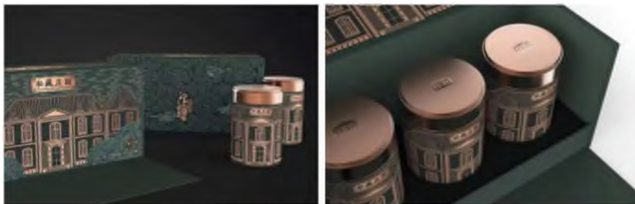
Зураг 3-4. Шицан жуанюань цай 8

“Чажоюгийн үзэмж төгөлдөр найман газрын үлун цай” нь Чажою нутгийн хамгийн алдартай “үзэмж төгөлдөр найман газар”-ыг загварын цөм илэрхийлэл болгож, гаднах хайрцагны дизайныг нээлттэй цонх хэлбэрээр гарган, эртний хийц маягийг орчин үеийн нөхцөл байдалтай уялдуулан тод томруунаар товойлгон харуулснаар байгалийн эрчмийг эртний хотын дүр төрхтэй хослуулан амьдлаг байдлаар харуулсан байна (Зураг 5-6).