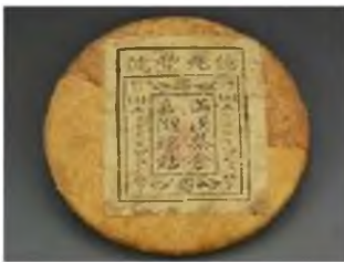
Зураг 1. Цаасан боодолтой цай 6

Сав баглаа боодол нь барааны болон хэрэглээний үнэ цэнийг давхар илэрхийлэх чухал арга хэрэгслийн нэг төдийгүй соёлын материаллаг тээгч юм. Хятадын цайны соёл өнө эртний арвин баялаг түүхтэй билээ. Эрт үед цайны гарал үүслийг “茶” (tu-gашуун өвс ногоо гэсэн утгатай) хэмээх ханзаар тэмдэглэж үлдээсэн байдаг ба харин Тангийн үеийн “цайны хутагт” гэж алдаршсан Лү Юу-гийн “Цайны судар” 5 -т (茶经) “茶” (cha-цай) ханзаар тэмдэглэж үлдээсэн байна. Цай хэмээх ундааг нийгээр ууж хэрэглэх болсноор сав баглаа боодол үүсч бий болоход гол хүчин зүйл болжээ. Тан гүрний үед ихэнх бараа таваар цаасан савлагаатай байсан бол (Зураг 1) Сүн гүрний үед хулсны навчинд цайг хадгалах болж (Зураг 2), Мингийн үед сонин содон цайны сав баглаа боодол аажмаар бий болжээ.