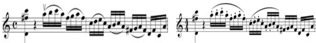
Зураг 1. 3-р сонат, 2-р анги, 11, 12-р айзмын боловсруулгын харьцуулалт

Ж.Барбер “Ф.Жеминианийн хийлд зориулсан сонат”-ийн эхний 6 зохиолын боловсруулгыг харьцуулсан байдаг. Тус судалгаанаас нэг жишээг тодруулбал, эх хувилбар нь цэгэн тэмдэглээ буюу стаккато болон холбоостой 8 эгшгийн шудраа байдаг. Тэрээр үүнийг “particolare” гэж нэрлэдэг бөгөөд энэ нь онцгой, хэцүү техник гэсэн утгатай. Энэ хэсгийг нумын үсэрч буй хөдөлгөөнөөр хөгжимдөх нь эргэлзээтэй бөгөөд Ф.Жеминиани “нум үргэлж утсан дээр байрлах ёстой, хөгжимдөж байх үедээ нумыг дээш өргөж хөндийрүүлж болохгүй” гэж сургадаг байсан. Харин Т.Дарт үүний талаар “энэ нь стаккато-г огт хөгжимдөхгүй гэсэн үг биш, гэвч хөгжимчид эсрэгээр нь холбоостой хөгжимдөж байна...” (Барбер 1964, 23) гэж хөгжимдлөгийн ялгааны талаар харьцуулан бичсэн байгаа юм. Ф.Жеминиани энэ хэсгийн боловсруулгад стаккато тэмдэглээг оноон хөгжимдөхдөө нумыг дээш нь өргөж хөндийрүүлэхгүй гүйцэтгэнэ гэж сургасны эсрэгээр хөгжимчид холбоостой хөгжимдөж байгааг ажигласан байгаа юм. Энэ нь нэг талаас хөгжимчний боловсруулга, хөгжмийн тайлбарлал буруу хийгдсэн, нөгөө талаас ур чадвар дутуу хөгжсөнтэй холбоотой ба стаккато зөв гүйцэтгэж чадахгүй байгаатай холбоотой байж болох юм. Тиймээс хөгжимчний ур чадвар, мэдлэг чухал болох, сайтар хөгжүүлэх шаардлагатай гэдгийг энэ жишээнээс харж болохоор байна.