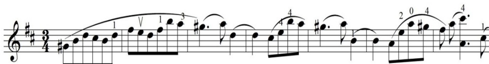
Зураг 2. И.Брамс хийлийн концерт 1-р анги, айзам 204-210.