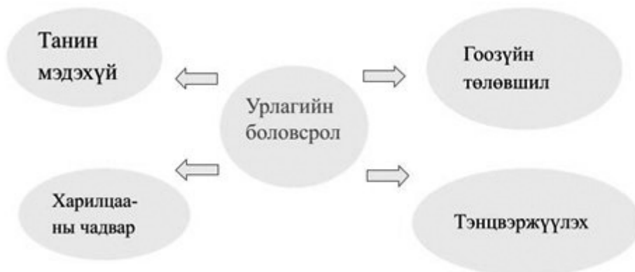
Зураг 1. Урлагийн боловсролын хүчин зүйлс

Урлагийн боловсролын ач тусыг хүний нийгмээс олж авсан хүмүүжлийн сууринаас илүүтэй төрмөл биологийн хүчин зүйлийн үндсэн суурин дээр авч үздэг. Хүн байгалиасаа бүтээлч байдалтай төрдөг нь “Бүтээлч чадварын хөгжил” гэх ойлголт бөгөөд бидний ихэнх нь бүтээлч чадвартай төрсөн, үүнийг урлагийн боловсролоор бага балчраас нь хөгжүүлэх чухал гэх үзэл баримтлах явдал юм.