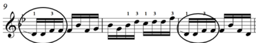
Зураг 21. “Янжуур тамхи” дууны хэсгээс

Чимэглэнгийн дараагийн хэлбэр болох айзмын эхний хувьд болон дунд байгаа эгшгийг гулсалтаар чимэглэн хөгжимдөх хувилбарыг бага хэрэглэсэн байна. Жишээ нь, “Соёл эрдэнэ” дууны 24-р айзамд 2-р наймцын фа эгшгийг ре-гээс, “Мэлхий” дууны 14-р айзмын 1-р наймцын солийг ре-с, 15-р айзмын 1-р наймцын ми-г фа-с, “Янжуур тамхи” дууны 9, 11-р айзмын ре-г фа эгшгээс тус тус гулсалт хийж хөгжимдсэн байна.