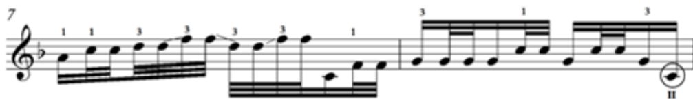
Зураг 13. Д.Дарьзавын хөгжимдсөн “Мэлхий” дууны хэсэг

Харин III чавхдасын задгай эгшиглээг суурь болгон баяжуулж хөгжимдөх аргыг “Янжуур тамхи”, “Хөх торгон дээл”, “Хүрэн хаалгатай дэлгүүр” дууны зарим айзмуудад хэрэглэжээ.