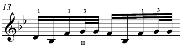
Зураг 8. Хөх торгон цамц дууны хэсэг

Ардын дууг хөгжимдсөн байдлыг хэмнэл талаас ажиглавал, “Соёл эрдэнэ” дуунаас бусад дуунуудад арванзургаатын давхар цохилгыг өргөн хэрэглэжээ. Үүгээрээ бусад шударгачдаас ялгаатай байна.