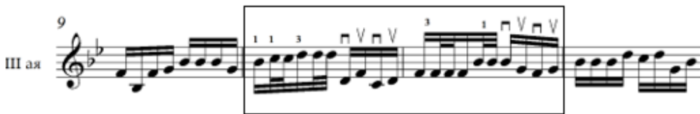
Зураг 6. Д.Дарьзавын давхар болон задгай цохилго хольж хөгжимдсөн “Хүрэн хаалгатай дэлгүүр” дууны хэсэг

Задгай болон битүү жигд эгшиглээний талаас ажиглавал, “Хөх торгон цамц” дууны 13, 29, “Мэлхий” дууны 15, 31-р айзмуудад 1-р наймцын соль эгшигийг II чавхдас дээр дарж битүү жигд эгшиглүүлсэн ба “Соёл эрдэнэ”, “Хүрэн хаалгатай дэлгүүр”, “Янжуур тамхи” дуунуудыг ерөнхийд нь задгай эгшиглээгээр хөгжимджээ.