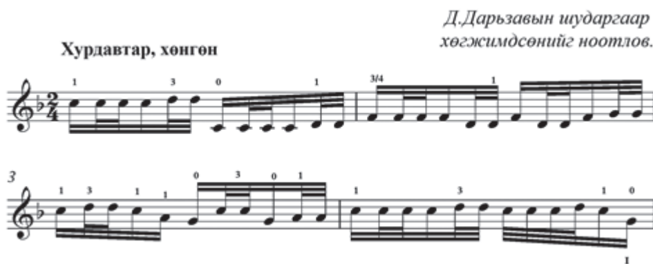
Зураг 2. Д.Дарьзавын давхар цохилгоор хөгжимдсөн “Мэлхий” дууны 1,3-р бадгийн хэсэг

Дээрх хүснэгтээс ажиглахад дууны бадгуудыг цохилгын төрлүүдээр өөр хооронд нь ялгаруулан дараах хэмнэлүүдээр хөгжимджээ. Үүнд: