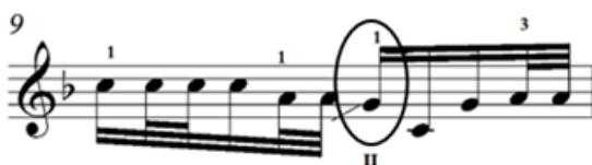
Зураг 22. “Мэлхий” дууны дунд хийсэн гулсалт