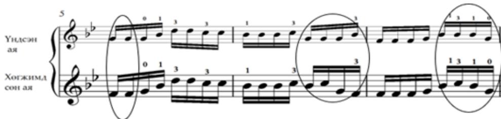
Зураг 19. “Соёл эрдэнэ” дууны дууны үндсэн аялгуутай харьцуулсан 5,6,7-р айзам