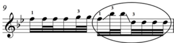
Зураг 16. Д.Дарьзавын хөгжимдсөн “Хөх торгон цамц” дууны 9-р айзам

Мөн дээрх нугалааг баруун гарын арванзургаатын задгай цохилго, зүүн гарын I хурууг хослуулан хөгжимджээ. Жишээ нь, “Янжуур тамхи” дууны 7-р айзам.