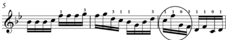
Зураг 17. Д.Дарьзавын хөгжимдсөн “Янжуур тамхи” дууны 6,7-р айзам

Мөн дээрх нугалааг баруун гарын арванзургаатын задгай цохилго, зүүн гарын I хурууг хослуулан хөгжимджээ. Жишээ нь, “Янжуур тамхи” дууны 7-р айзам.