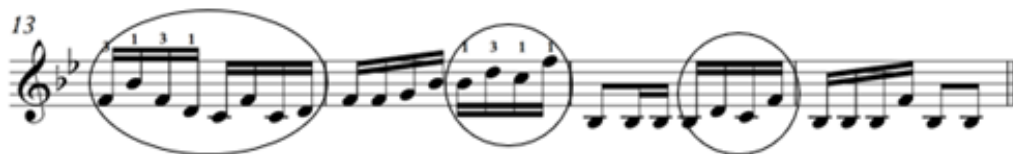
Зураг 20. “Янжуур тамхи” дууны 13,14-р айзам