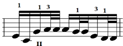
Зураг 7. Мэлхий дууны хэсэг

Задгай болон битүү жигд эгшиглээний талаас ажиглавал, “Хөх торгон цамц” дууны 13, 29, “Мэлхий” дууны 15, 31-р айзмуудад 1-р наймцын соль эгшигийг II чавхдас дээр дарж битүү жигд эгшиглүүлсэн ба “Соёл эрдэнэ”, “Хүрэн хаалгатай дэлгүүр”, “Янжуур тамхи” дуунуудыг ерөнхийд нь задгай эгшиглээгээр хөгжимджээ.