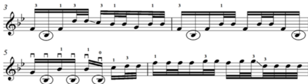
Зураг 14. Д.Дарьзавын хөгжимдсөн “Хөх торгон дээл” дууны хэсэг

Харин III чавхдасын задгай эгшиглээг суурь болгон баяжуулж хөгжимдөх аргыг “Янжуур тамхи”, “Хөх торгон дээл”, “Хүрэн хаалгатай дэлгүүр” дууны зарим айзмуудад хэрэглэжээ.