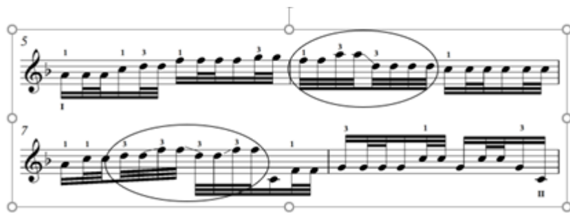
Зураг 9. Д.Дарьзавын давхар цохилгоор хөгжимдсэн “Мэлхий” дууны хэсэг

“Соёл эрдэнэ”, “Янжуур тамхи” дууны задгай цохилгоор хөгжимдсэн бадгуудад наймт арванзургаатын хэмнэлийг цөөн тоогоор хэрэглэсэн ба “Мэлхий”, “Хөх торгон цамц”, “Хүрэн хаалгатай дэлгүүр” дууны задгай цохилгоор хөгжимдөх бадгуудыг арванзургаатын хэмнэлээр тасралтгүй эгшиглүүлэн хөгжимджээ. Дээрх таван дууны бадгуудын төгсгөлийг наймт хэмнэлээр хөгжимдсэн байна. Тод, эрэмгий, ганган цохилгоор задгай эгшиглээгээр хөгжимдөх байдал нь МУГЖ С.Базаррагчаатай нэлээн төстэй байна. С.Базаррагчаа “Ганьхуар цаас”, “Аргагүй амраг”, “Хандармаа”, “Сүнжидмаа”, “Янлинхуар”, “Сэр сэр салхи” зэрэг дуунуудыг задгай эгшиглээгээр хөгжимдсэн байдаг.