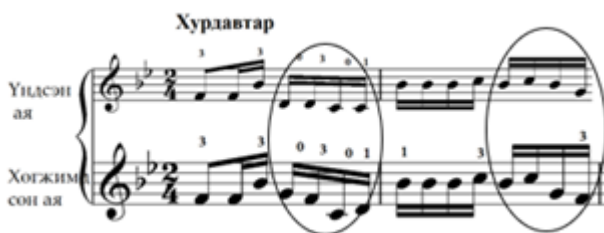
Зураг 18. “Соёл эрдэнэ” дууны үндсэн аялгуутай харьцуулсан 1,2-р айзам

Аялгууны үндсэн эгшгийн олон давталтыг тохирох эгшгээр сольж баяжуулан нугалааг гаргажээ. Үүнд “Соёл эрдэнэ” дууны 1, 2, 5, 6, 7, “Янжуур тамхи” дууны 8, 13, 14-р айзам гэх зэрэг нэлээн олон жишээ байна.