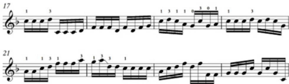
Зураг 3. Д.Дарьзавын задгай эгшиглээгээр хөгжимдсөн “Мэлхий” дууны 2-р бадаг