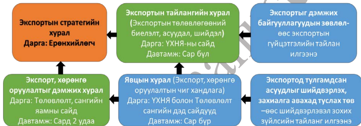
Зураг 1. БНСУ-ын Засгийн газрын экспортын хурал, хэлэлцүүлгийн процесс

оролцуулах замаар экспортыг нэмэгдүүлэх, экспортод тулгамдсан асуудлыг хэлэлцэн шийдвэрлэх боломжтой байдгаараа өндөр ач холбогдолтой юм. БНСУ-ын өнөөгийн ерөнхийлөгч Юн Сок Ёль нь ажил үүргээ хүлээн авсан 2022 оны 5 сараас хойш 4 удаа экспортын стратегийн хурал хийгээд байна. Ерөнхийлөгч нь гүйцэтгэх засаглал болон хувийн хэвшлийг экспортод чиглүүлэх, манлайлах үүрэг гүйцэтгэдэг байна.