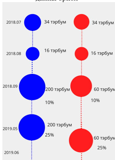
Зураг 1. АНУ-БНХАУ-ын худалдааны дайны өрнөл 12

Гаалийн татвараар нэгнээ давах гэсэн тулаанд АНУ илт давуу байр суурьтай байсны дээр Хятадыг гарцаагүй байдалд оруулахын тулд тус улсын технологийн шилдэг компани болох Хуавэй компанийг онилсон. Ингээд АНУ тус компанийг Хятадын засгийн газартай нягт холбоотой ажилладаг, тоног төхөөрөмжөө тагнуулын зорилгоор ашигладаг байж магадгүй хэмээн болгоомжилж буйгаа мэдэгдсэн юм. Үүнээс үүдэн, 2019 онд баталсан АНУ-ын Үндэсний батлан хамгаалах тухай хууль (National Defense Authorization Act)-ийн 889